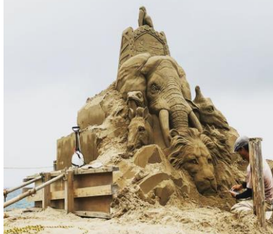
秋田県三種町のサンドクラフト 今年のテーマ 「Sand Zoo～砂の動物園」

スマホ普及が後押しする「オンデマンド保険」は、きめ細かいニーズに低額で対応する新たな時代を予感させる画期的なサービスとして注目したいものです。